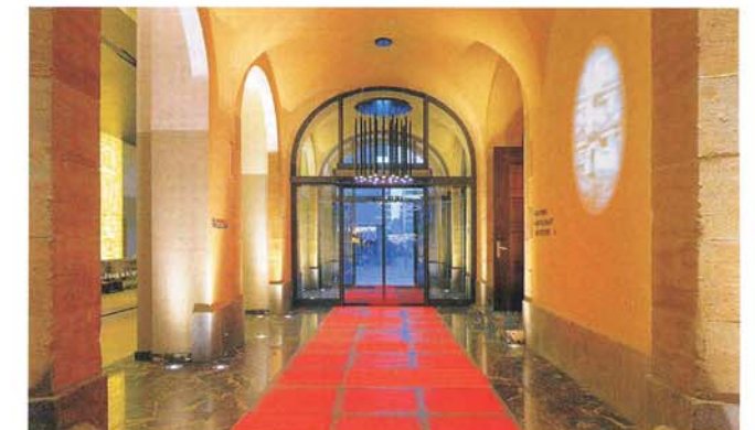
Blick durch den Gewölbegang auf den Hoteleingang, links der Empfangsbereich. Alte Bausubstanz trifft auf elegant spiegelnden Kalksteinboden.

Architektur, die branchenspezifische Prozesse berücksichtigt und integriert, den effizienten Betrieb unterstützt und das Gesamtkonzept optisch widerspiegelt.