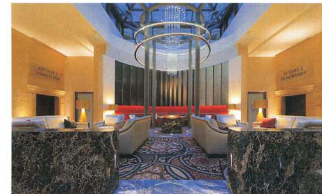
Blick nach oben auf eine der beiden Glaskuppeln des Lichthofs. Im Zentrum der Dachkonstruktion ist eine vertikale Lichtstruktur aus Acrylglas abgependelt, um die zwei horizontale Saturnringe kreisen. Die Feuerschale auf dem Kaminpodest bildet den Mittelpunkt der Lobby.

Das Betthaupt, dessen Gestaltung von der Anmutung gestapelter Tuchballen inspiriert ist, erinnert an die Tradition des Handelshofes als Haus der Textilmesse.